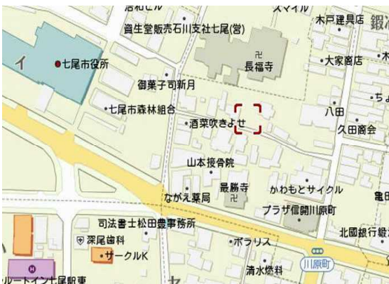
4月17日(日) 七尾市川原町の桜①