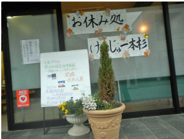
「けいじゅ一本杉」正面