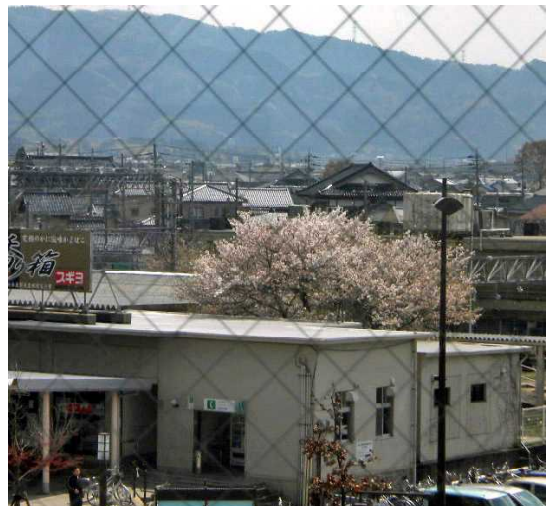
ミナ・クルから見る七尾駅裏に咲く桜

この日もワンちゃんが「でか山」を眺めていたので、策の上からパチリ。ポクも「でか山」に乗ってみたいワン。