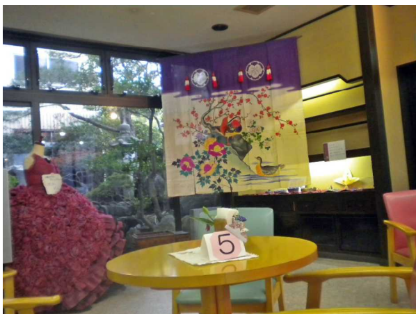
「けいじゅ一本杉」店内の花嫁のれん