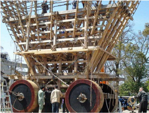
4月17日(日)・鍛冶町のでか山「山王神社」④