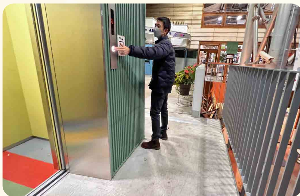
エレベーターの操作ボタンの設置位置が高い