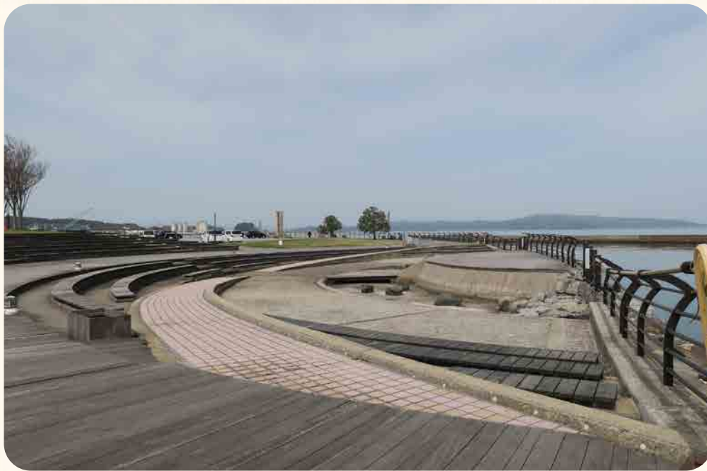
ベンチに座り、海を眺めながらの飲食は最高

前方は親水広場、右手奥が芝生広場。親水広場は海側のステージを囲むように、半円形にベンチが配置されている。