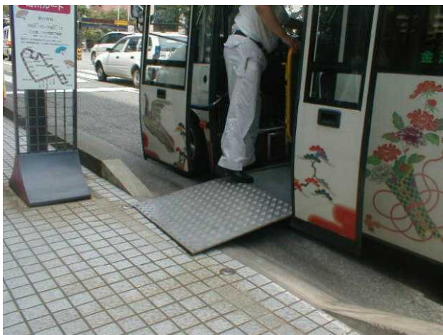
車いす乗車スロープ