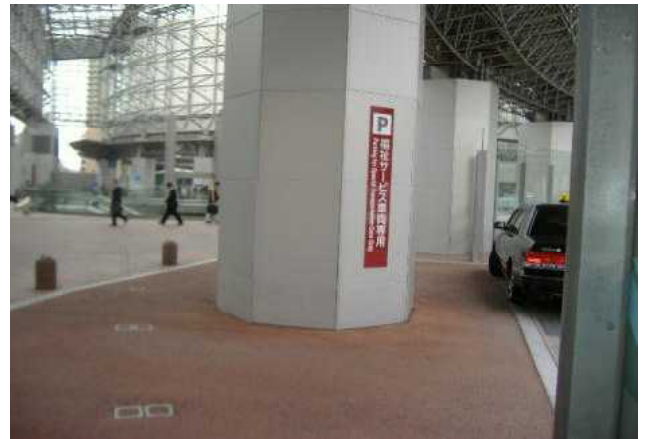
福祉サービス車両専用駐車場