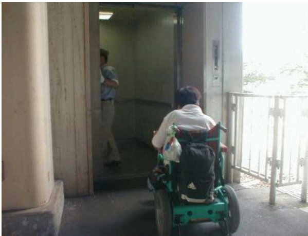
以前は貨物用エレベーターを使用