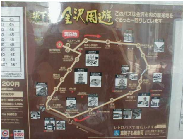
金沢周遊バス案内