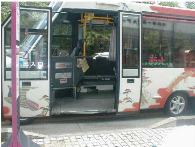
ふらっとバス乗車口