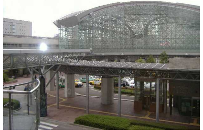
金沢駅もてなしドーム