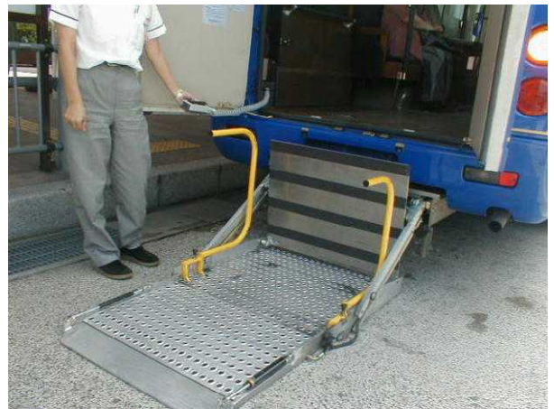
後ろからも乗車可能