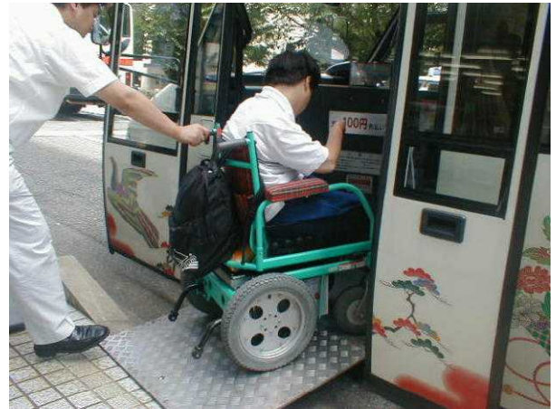
介助者がなしでも、運転手さんが対応