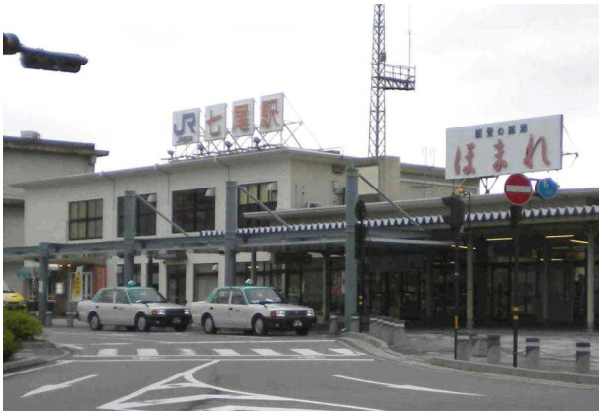
J R 七尾駅の正面