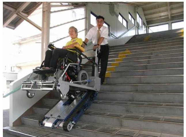
駅員さんの負担も減ります。