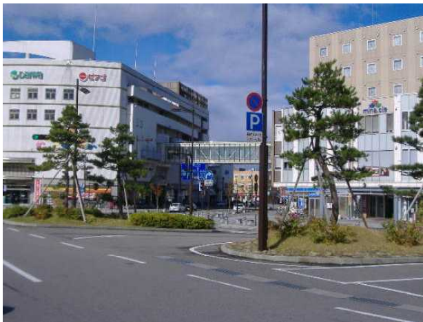
「パトリア」と「ミナ・クル」