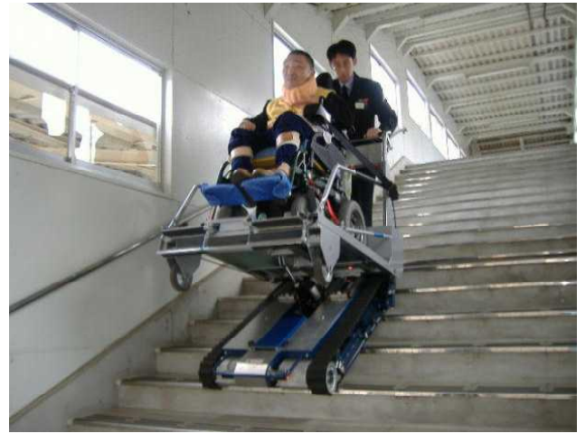
④このように階段の上り下りします。