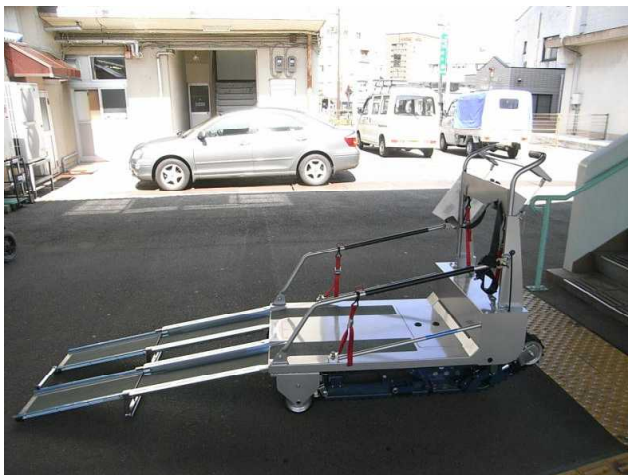
準備された階段昇降機