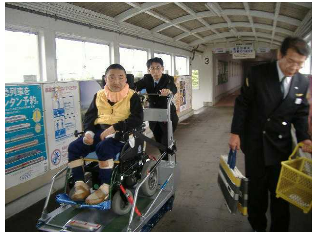
⑤羽咋駅の陸橋を渡っています。