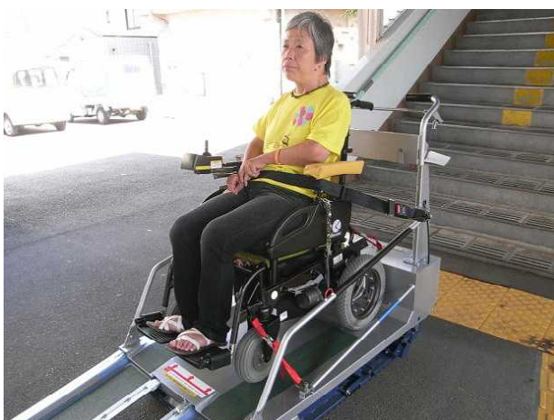
階段昇降機に乗車