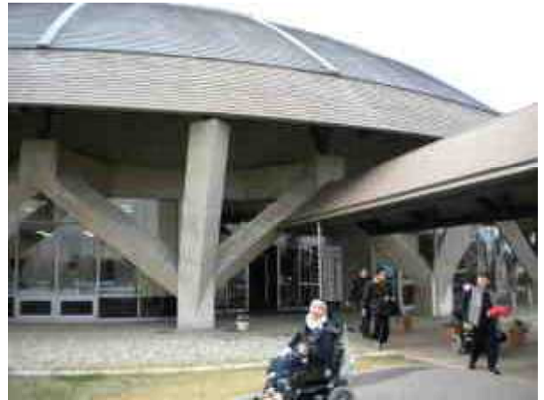
コスモイル羽咋の正面玄関