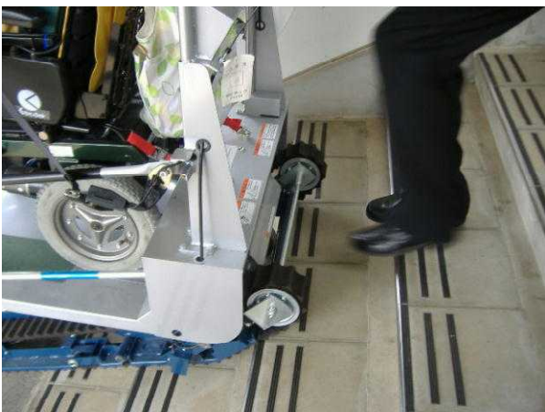
③階段を上り始めました。