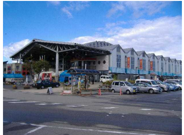
能登食祭市場正面広場