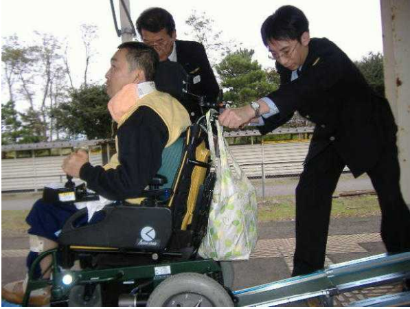
①スロープを使い昇降機に乗車