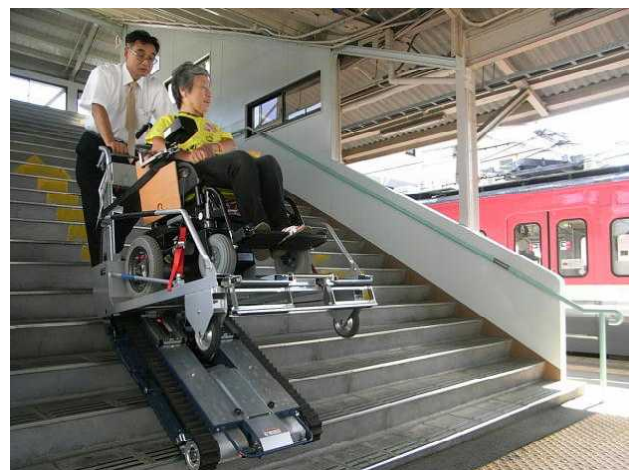
良い眺め。あの電車に乗って来たの？