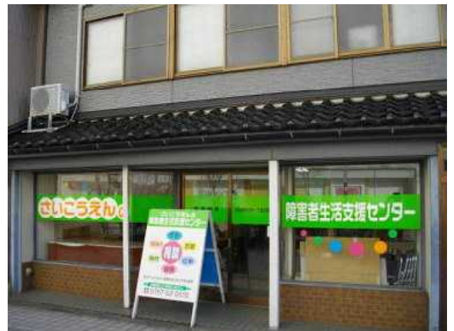
JR七尾駅から徒歩1分の地域活動支援センター