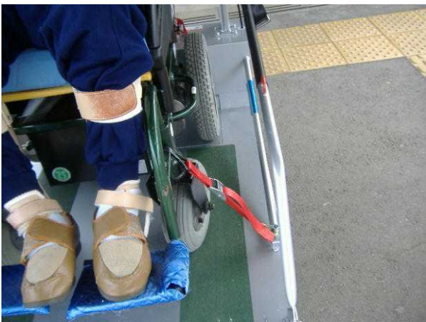
②しっかりベルトで固定