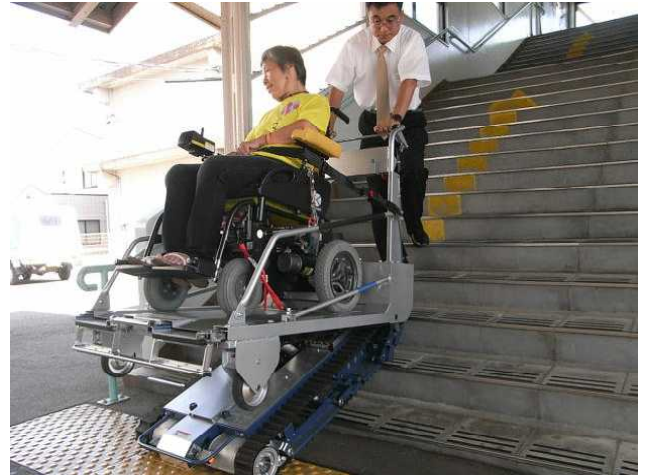
階段を上り始めました。