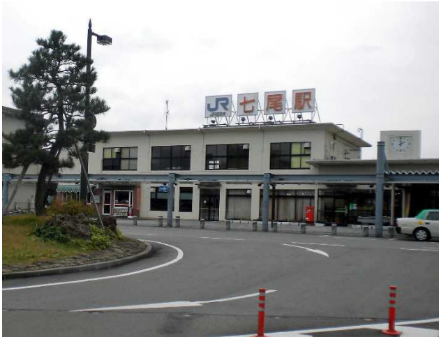
JR七尾駅・時計も新しく設置