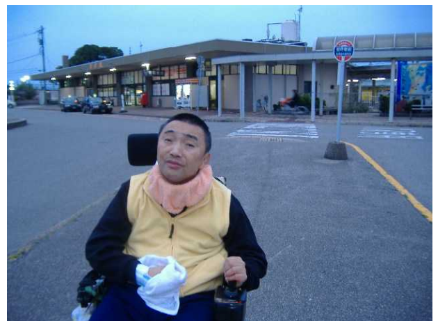
J R 羽咋駅前に到着。七尾へ帰ります。