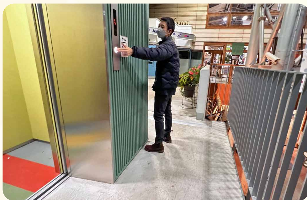
エレベーターの操作ボタンの設置位置が高い