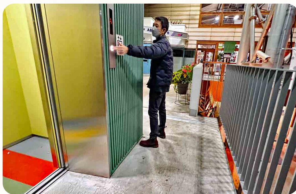
エレベーターの操作ボタンの設置位置が高い