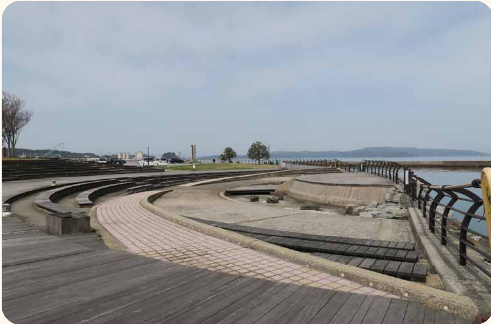
ベンチに座り、海を眺めながらの飲食は最高

前方は親水広場、右手奥が芝生広場。親水広場は海側のステージを囲むように、半円形にベンチが配置されている。