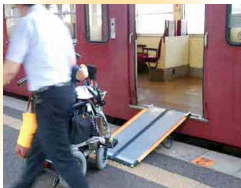
① ケアスロープを準備