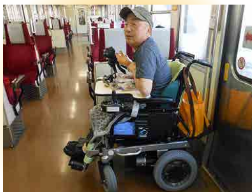
⑤ 列車の定位置に着く

ケアスロープを使用して乗車しますが、ケアスロープの幅が85cmと狭く、電動車いすの操作技術が必要です。