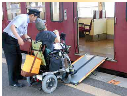
② ケアスロープを上る