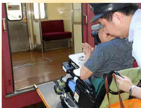
③ 駅員の介助を受けて