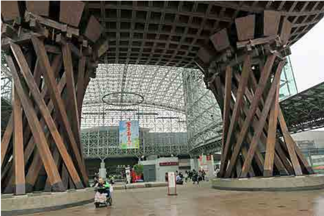
「百万石まつり」を迎える鼓門