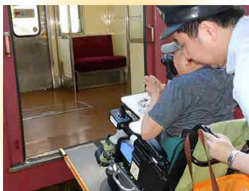
③ 駅員の介助を受けて