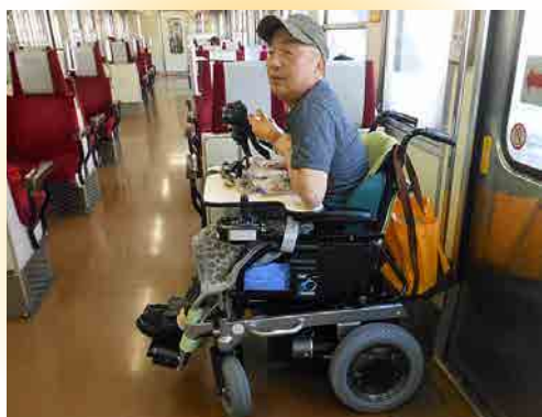
⑤ 列車の定位置に着く

ケアスロープを使用して乗車しますが、ケアスロープの幅が85cmと狭く、電動車いすの操作技術が必要です。