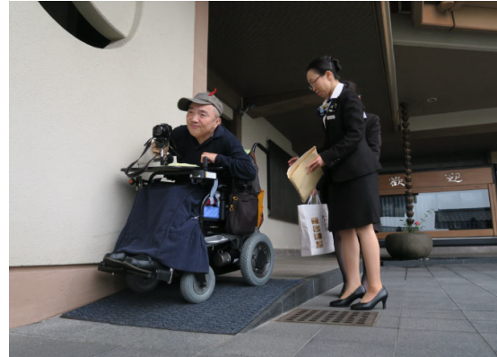
スロープのチェック

「加賀屋」のバリアフリー化を進めていく上で、老舗の旅館ならではの苦勞があることを聞きました。