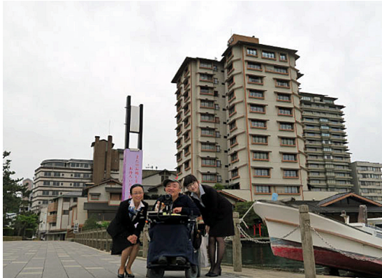
加賀屋の案内係と記念撮影