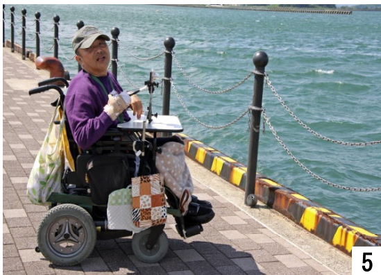
カメラ目線を見ないで――