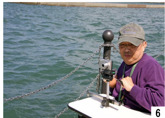
被写体にピントを合わせて