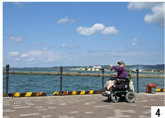
陽差しが強く、カメラの画面が見にくい