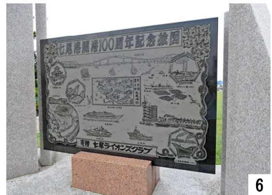
七尾港開港100周年記念絵図の記念碑