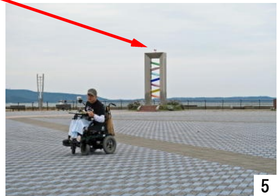
七尾マリンパークに建つ「虹の塔」