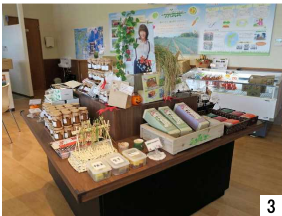
「まれ」を能登野菜の加工食品が応援

能登産の野菜、加工食品が並べられ、ハロウィンが近く南瓜が下がっている。9/16取材