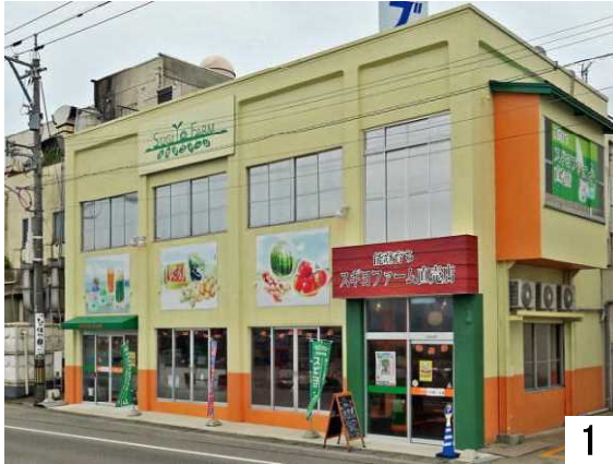
スギヨファーム直売店正面(能登食祭市場前)

農薬、化学肥料を使わず、体に優しい野菜を育て、加工、販売を行っている直売店です。