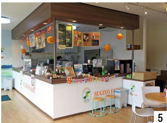
喫茶コーナー(野菜ジュース・コーヒー等)