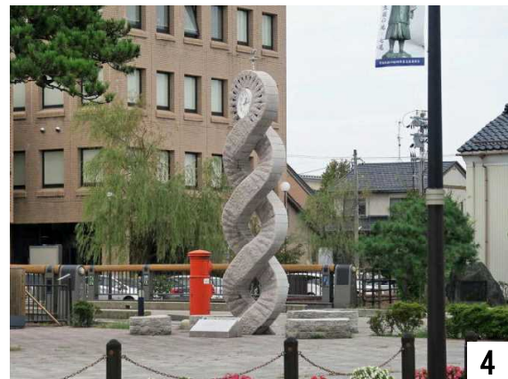
4 慶応橋の右横にある公園