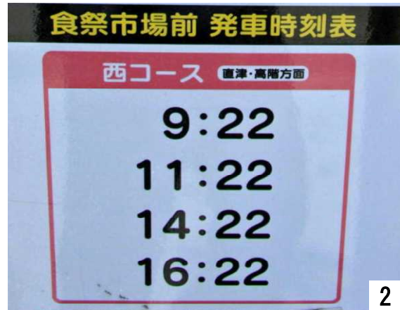
ぐるっと7直津町方面バス時刻表

弟：お姉ちゃん、能登食祭市場前からぐるっと7に乗り、青山彩光苑へ行って来ましょう。