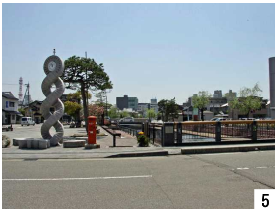
5 慶応橋から見る御祓川の静かな流れ