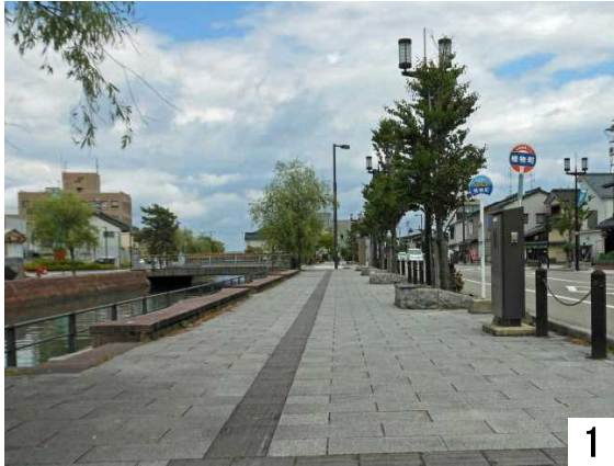
1 桧物町バス停から慶応橋へ

御祓川大通りを慶応橋に向かいます。橋の近くに大きな紫陽花が咲いているので撮影します。