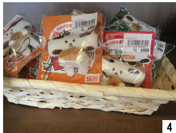
スギヨと言えば、ちくわですね。