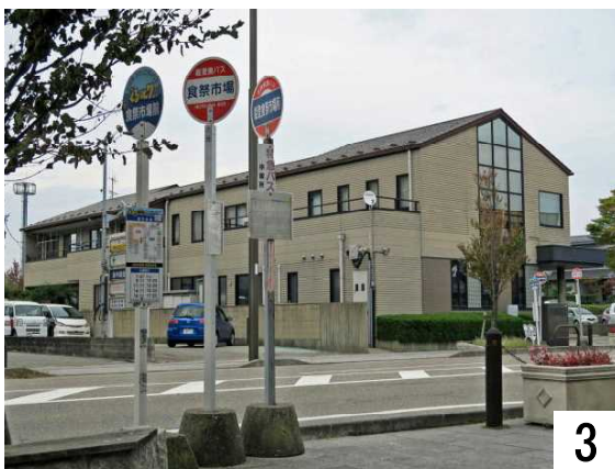
ぐるっと7のバス停(七尾駅行)