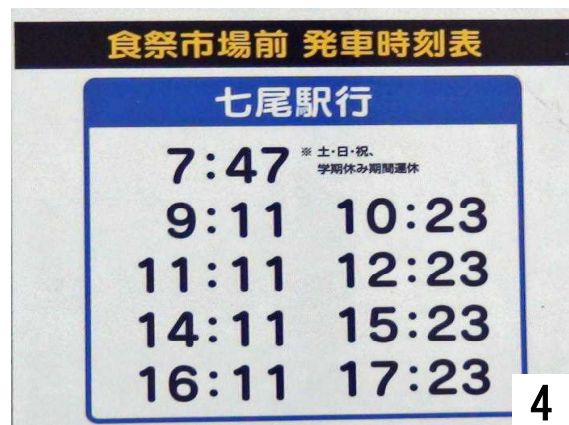
ぐるっと7七尾駅行バス時刻表