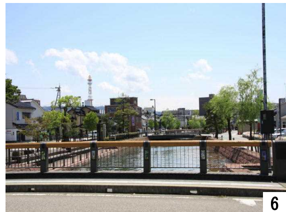
6 慶応橋から見る御祓川の静かな流れ