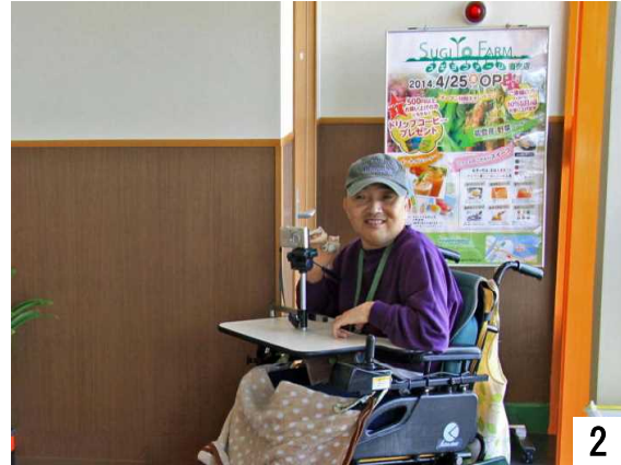
2014年4月25日にオープンしました。