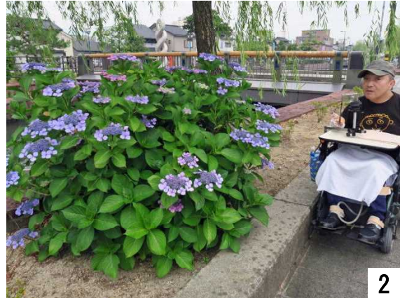
2 慶応橋近くに咲く大きな紫陽花