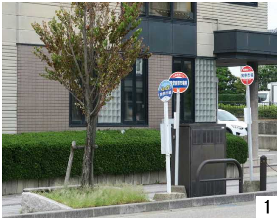
ぐるっと7のバス停(直津町方面)