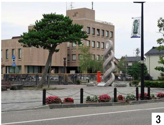
3 慶応橋・七尾商工会議所