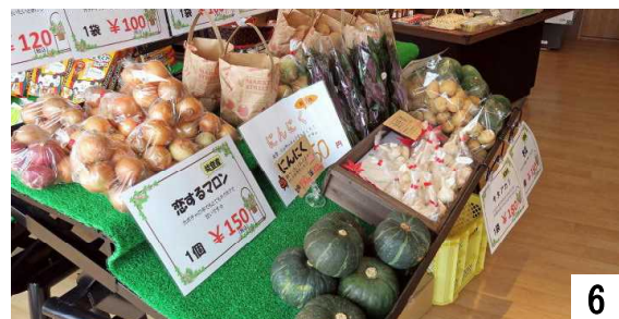
能登産の野菜が安値で販売。