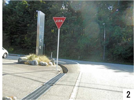
2 市道から県道を撮影