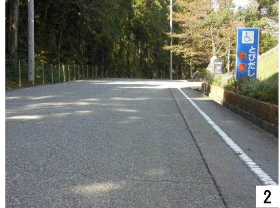
県道116号から苑の玄関方向