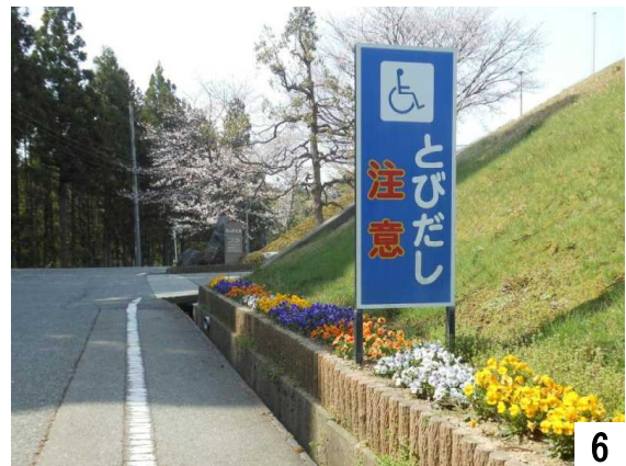
車いすが通行します。飛び出しに気をつけてね。