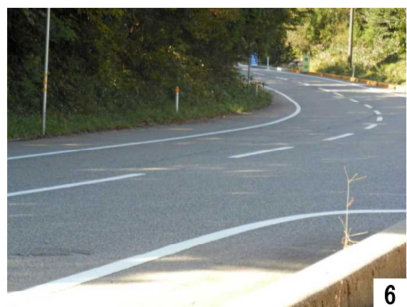
6 県道116号線(池崎～直津) 職員駐車場前