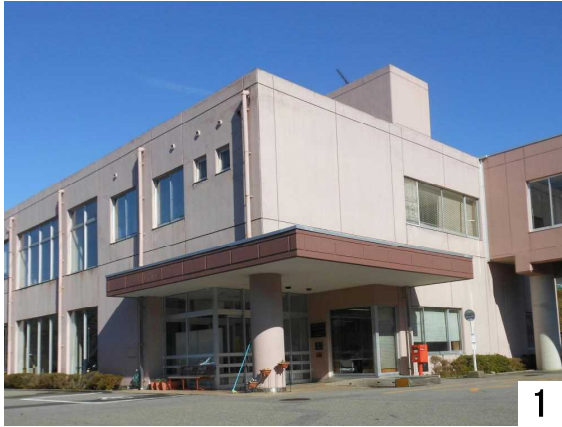
青山彩光苑の正面玄関

県や市に要望していた「石川県道116号末吉七尾線」の道路改良工事が2014年8月に完成。