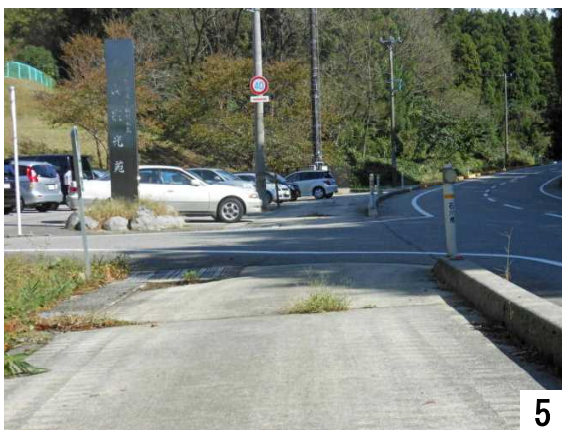
5 青山彩光苑から県道へ(職員駐車場前)