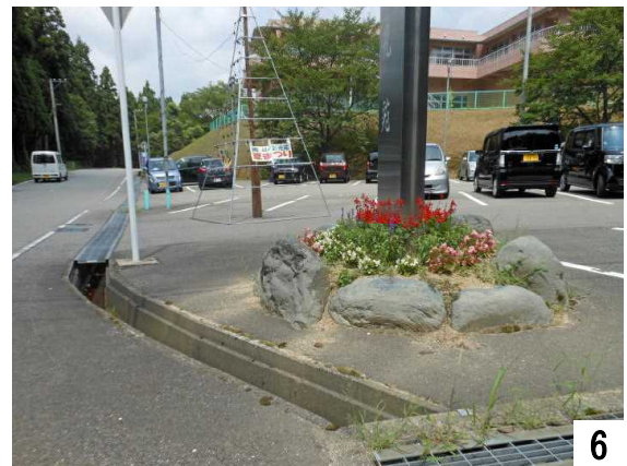
夏はサルビア、ペゴニア