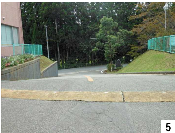
正面玄関の坂、下り方向から撮影