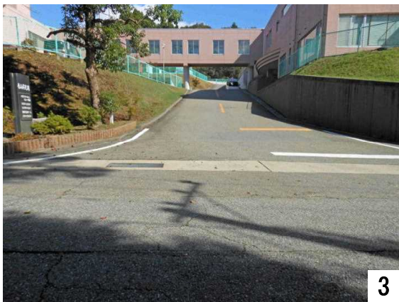
正面玄関の坂(下りから上り方向)