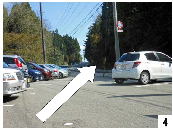
職員駐車場から県道116号へ