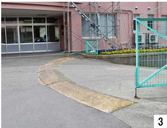
正面玄関の薄鋭形の車止め

正面玄関の車止めを超えて危険な坂を下り、 県道116号末吉七尾線に出て行きます。