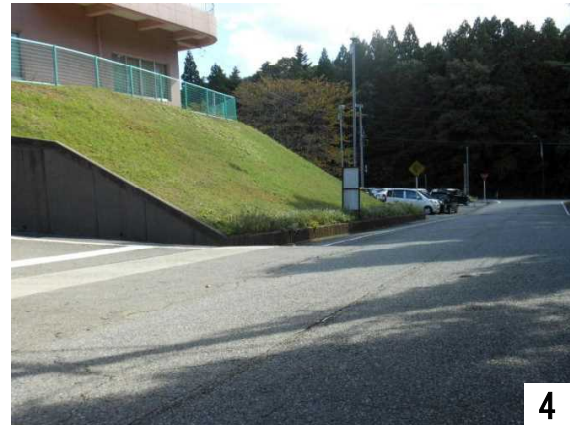
正面玄関から県道へ向かいます。