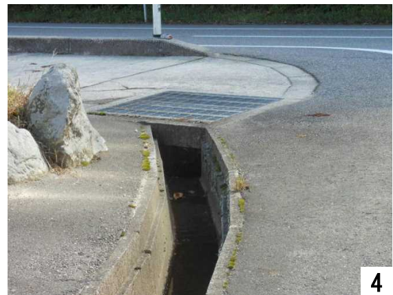
4 怖い、車いすが転倒するよ。