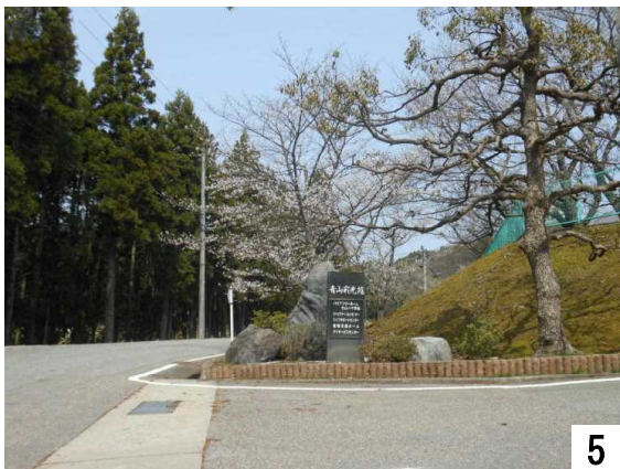
来客を満開に咲く桜で出迎えます。