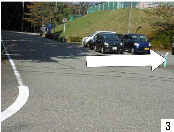
苑の私道から職員駐車場へ