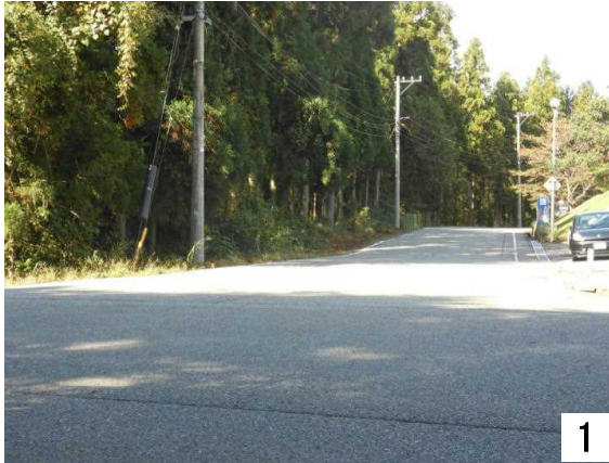
1 県道から市道を撮影