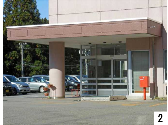
青山彩光苑の正面玄関、バス停