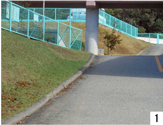
正面玄関の坂(左側)