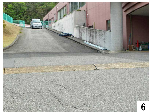
正面玄関の坂、上り方向から撮影