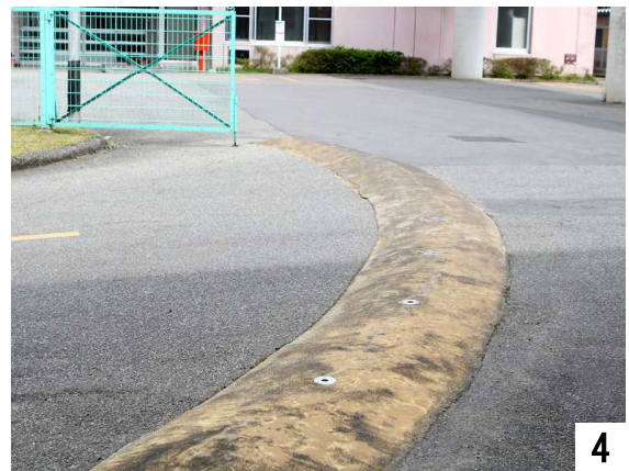
正面玄関から下り坂へ