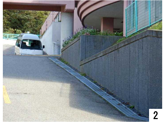
正面玄関の坂(右側)