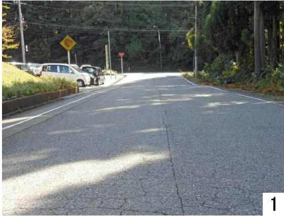
苑の玄関から県道116号方向