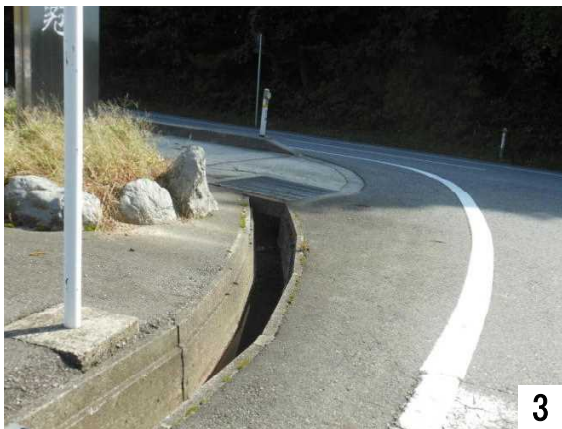
3 脱輪の危険がある溝

市道から「石川県道116号末吉七尾線」へ出口に溝あり、車いすの脱輪に注意が必要です。