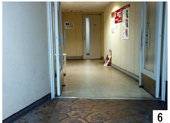
突き当たりに、トイレの案内が出ている。