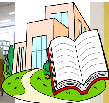
図書館にも北陸新幹線開業ポスター