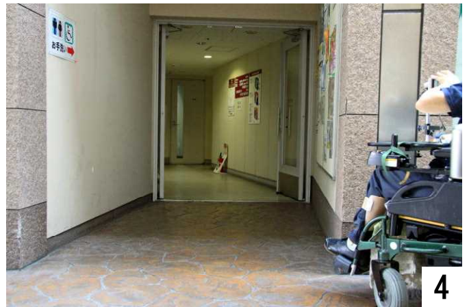
トイレ、駐車場の案内(入り口正面より撮影)