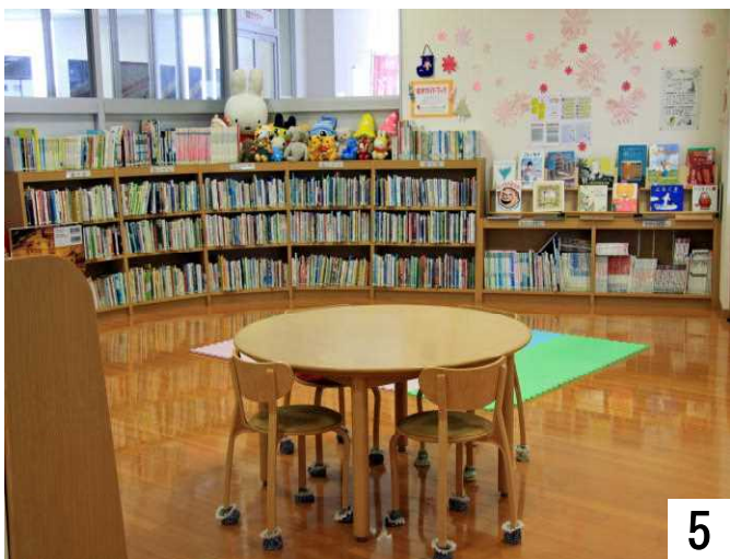
幼児の絵本、童話。子供が楽しめる遊具もあるよ。