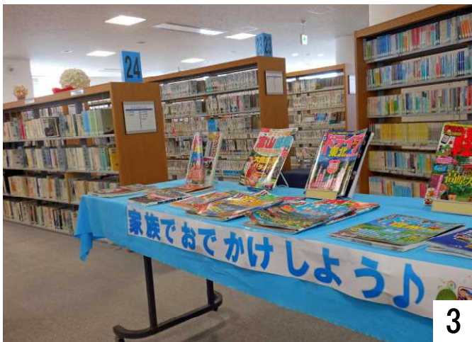
3 家族旅行に役立つ旅事情報誌がずらり

北陸新幹線の金沢開業に合わせ、富山、上高地、軽井沢など長野県方面の情報誌が展示中