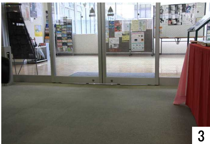
七尾市立図書館の正面に到着しました。