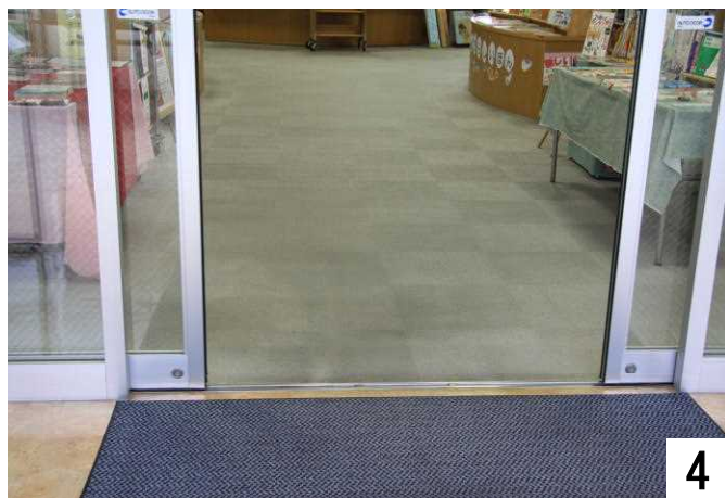
自動ドアを開け、館内へ入ります。