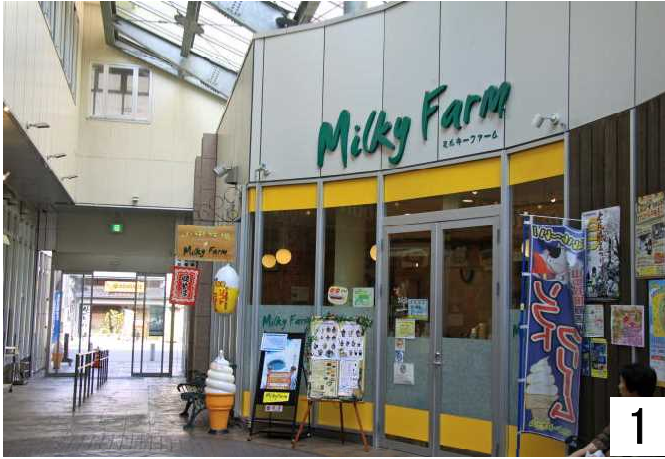
ミルキーファーム前よりトイレに向かう。

「ミナ・クル」一階、多目的トイレの位置がわかりにくいので紹介します。造りは福祉課と同じです。