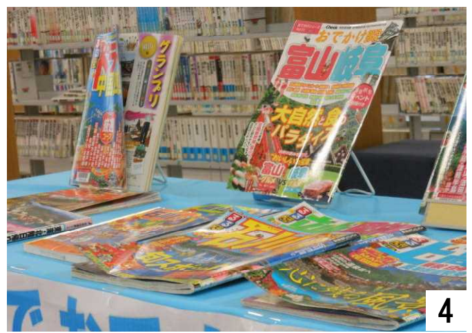
4 北陸新幹線に乗り上高地へいかが？