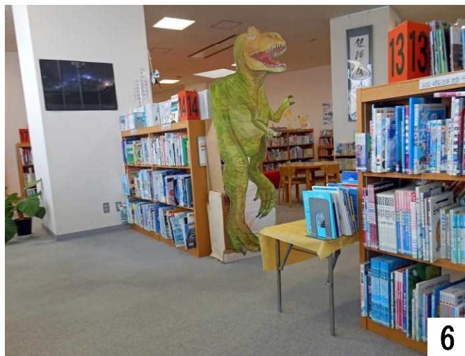
恐竜関係の図鑑、参考書も揃っています。