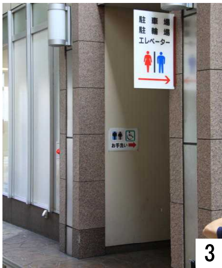
トイレ、駐車場の案内(七尾駅より撮影)