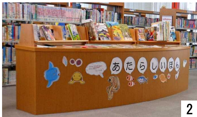
児童のあたらしいほんのコーナー