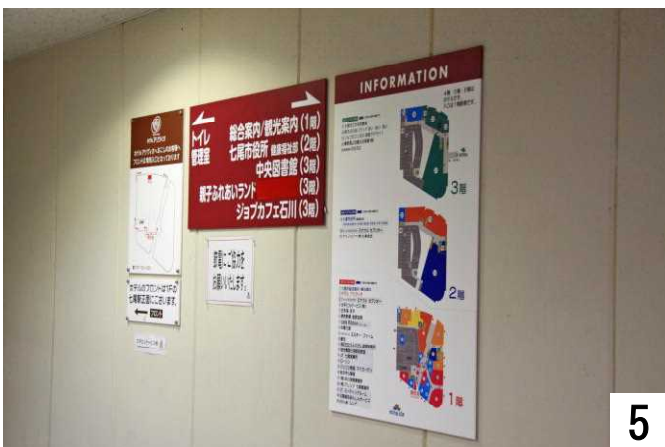
トイレへ向かう廊下中央に案内板。