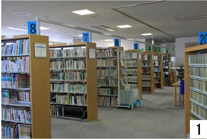
1 小説など、読んで見たくなる本が並んでいる。

図書館と言えば、小説、文庫本ですね。静かな環境で好きな一冊をゆっくり味わいましょう。