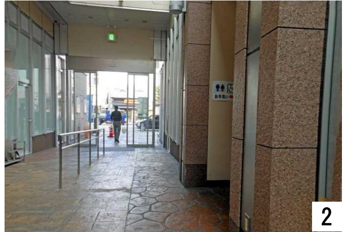
トイレの案内が見えます。