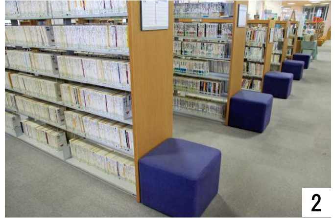
2 こちらは文庫本ですね。