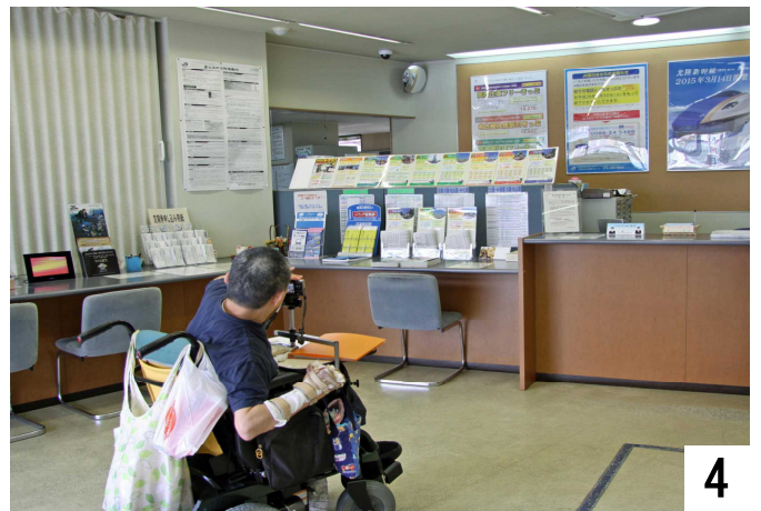
「きっぷうりば」で乗車券を購入。