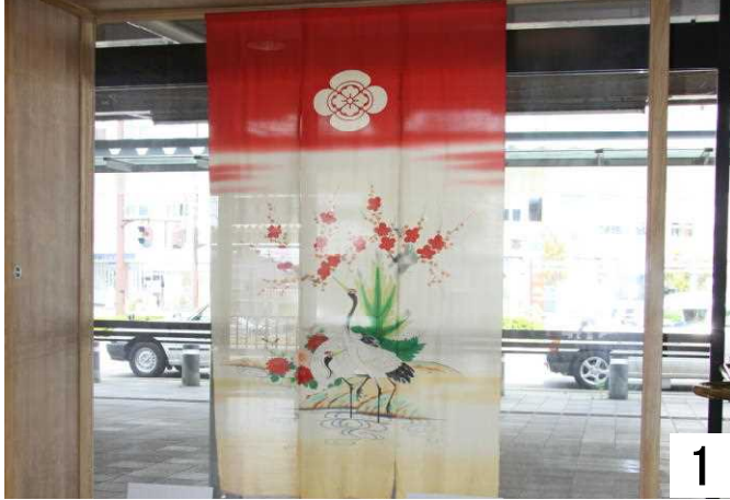
駅正面玄関に展示中の「花嫁のれん」

駅正面に、5月の連休に七尾市一本杉町商店街で開催の「花嫁のれん展」ののれんを展示しています。