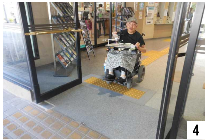
正面玄関から駅前へ