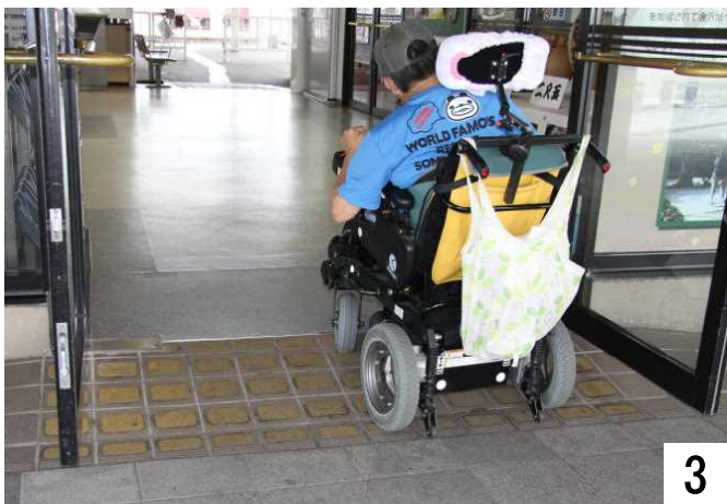
正面玄関から駅構内へ入る