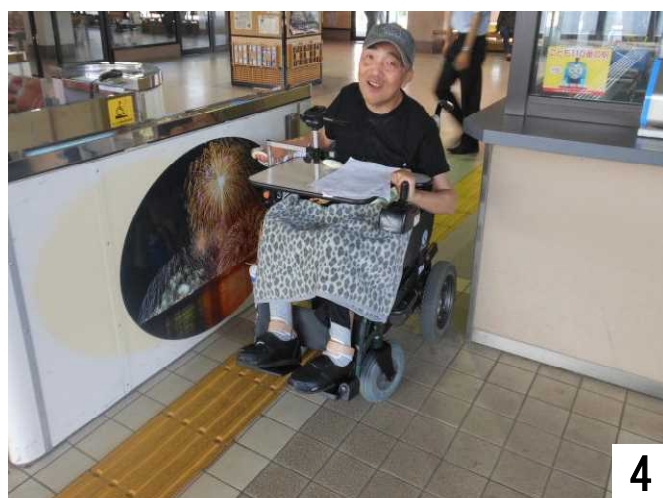
列車に乗り、金沢へ。