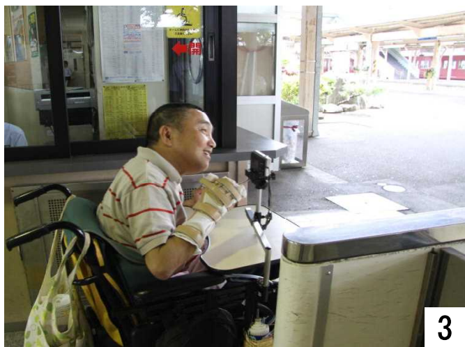
改札口からホームへ出て、列車に乗ります。