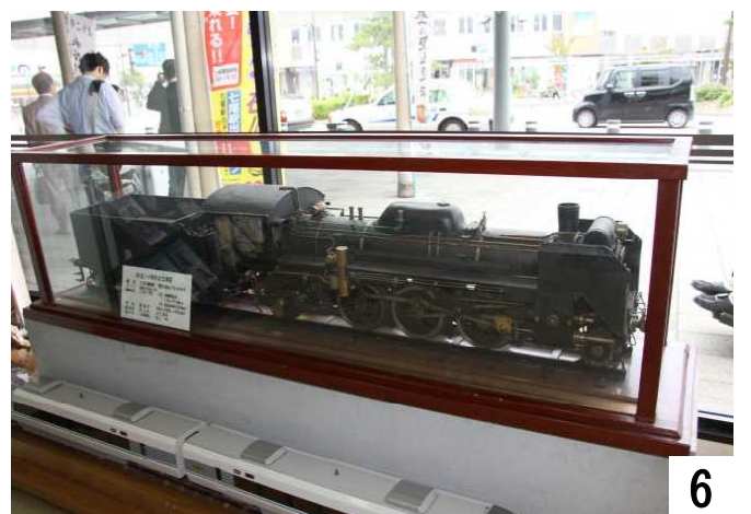
「きっぷうりば」に展示中のSL