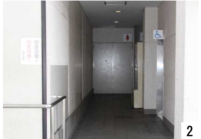
多目的トイレの案内が見えます。