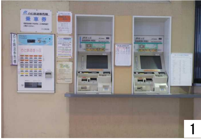
自動券売機

自動券売機に挑戦しましたが、現金投入口に手が届かないし、お金を入れることが不可能です。