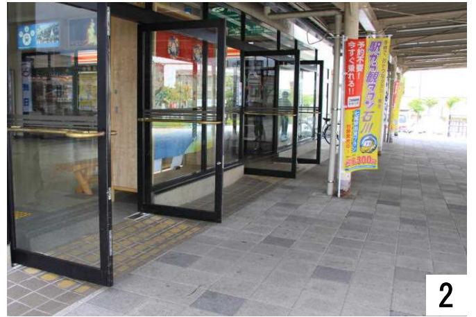
スロープが整備され、駅の入出りが気軽です。