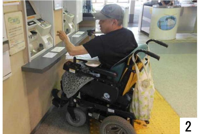
自動券売機で購入