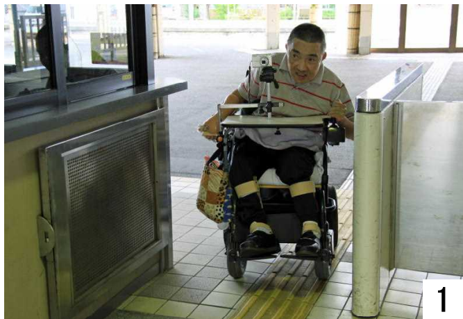
七尾駅に到着し、改札口を通ります。