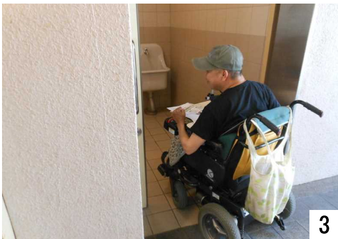
段差のないドアを開け、トイレに入る。