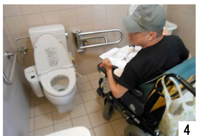
便座が低く、使いにくい。但し、個人差あり。