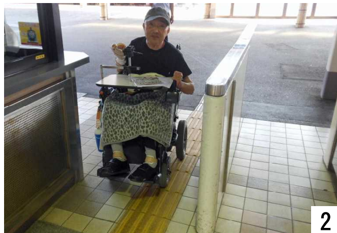
改札口が狭く、駅員出入口より