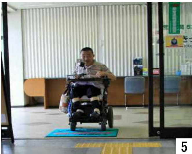
「きっぷうりば」で乗車券を購入しました。