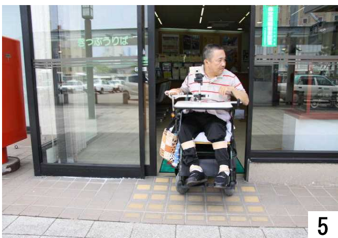
「きっぷうりば」からも正面に出入りできる。