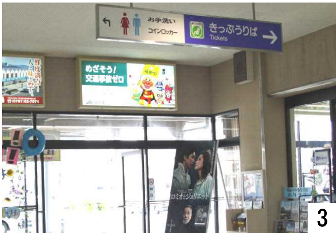
正面玄関から「きっぷうりば」へ入ります。

自動券売機に挑戦しましたが、手が届かないので「きっぷうりば」で乗車券を購入します。