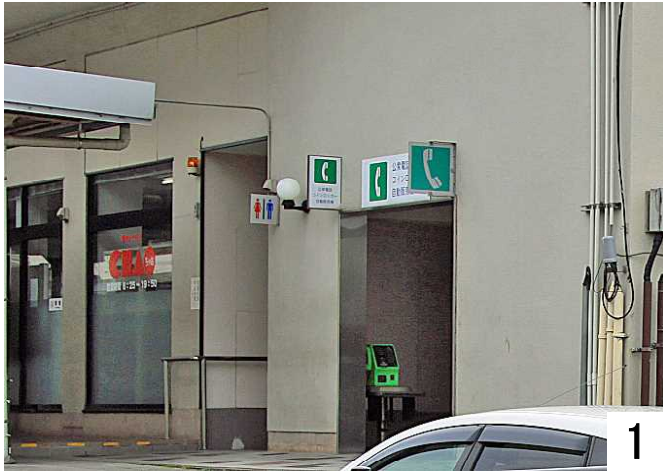
駅のコンビニの隣りに、トイレがあります。