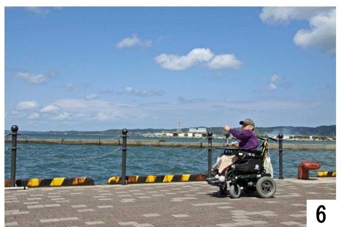
5月16日(金) 取材後、食祭市場で昼食。