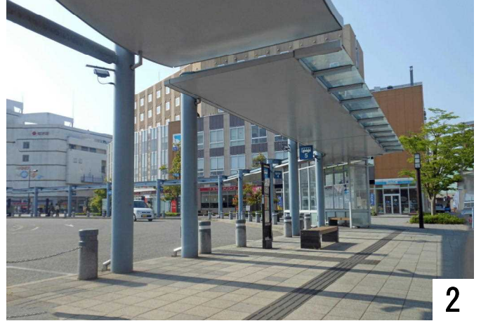
5月30日(金) JR七尾駅改札口