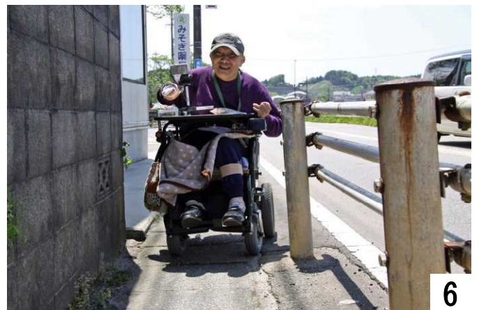
さあ、挑戦。この歩道を通ってみよう。