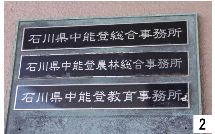
県の中能登の事務所が入っています。