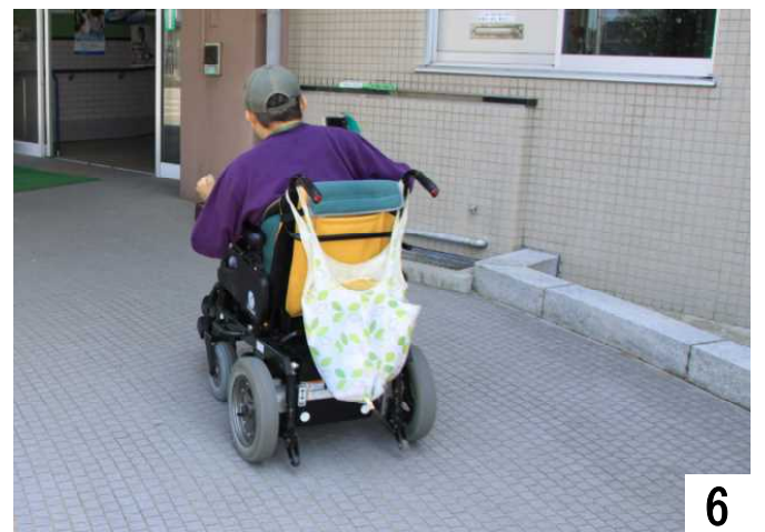
もうすぐ、正面玄関です。