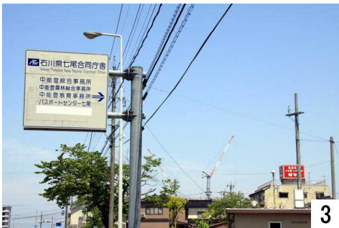
中能登総合事務所の案内が建っています。