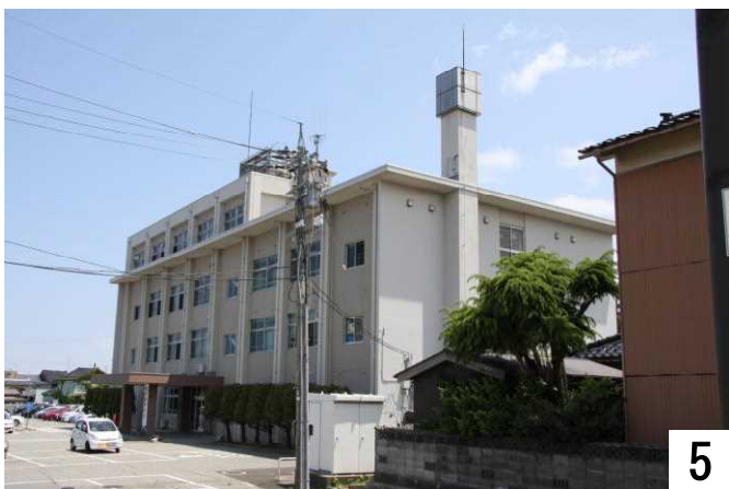
小丸山城址公園方面より入って行きます。