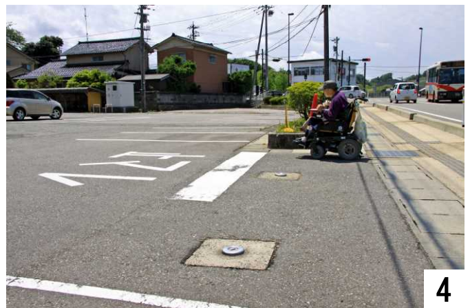
中能登総合事務所の駐車場から入って行きます。