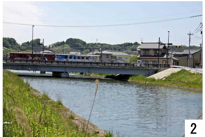
JTBを直進すると和倉温泉、輪島方面へ