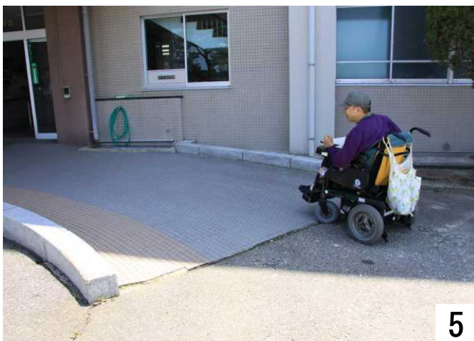
今回は、右のスロープから入ります。