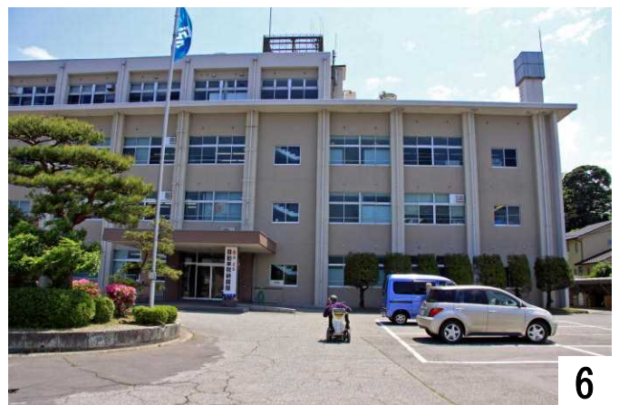
正面入り口に向かっていきます。