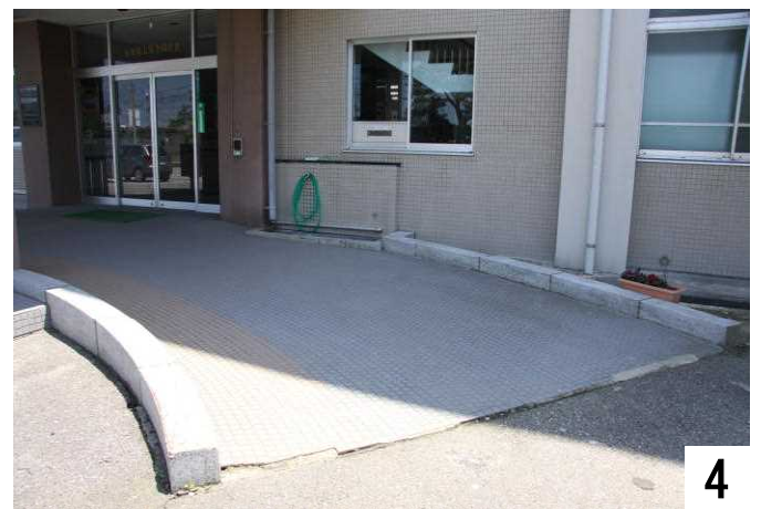
正面玄関、右側のスロープ