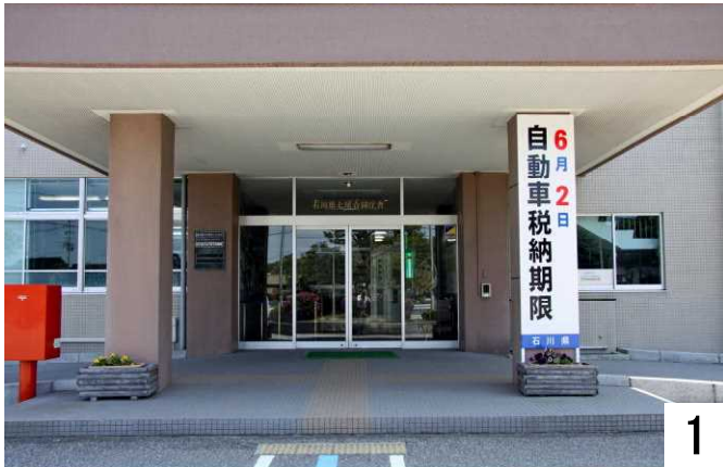
「石川県七尾合同庁舎」とも呼ばれています。