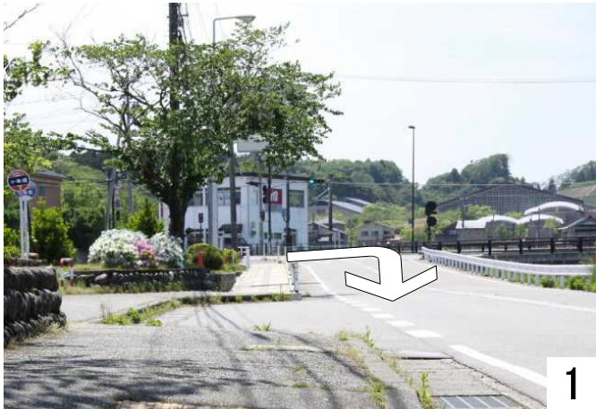
JTBを右へ廻ると総合事務所、七尾港方面へ

JTBから中能登総合事務所へ向かっています。 御祓川の陸橋にのり、鉄道の電車が走っていました。