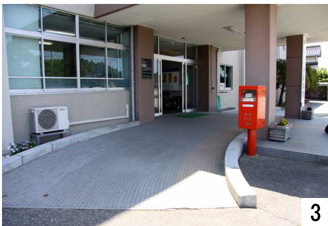
正面玄関、左側のスロープ。郵便ポストあり。

正面玄関を3方向から撮ってみました。中心は段差ですが、左右にスロープが設置されています。