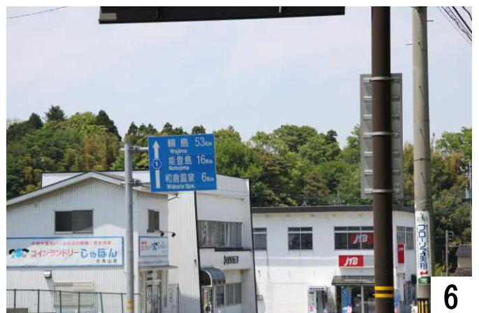
県道一号線には広い歩道があります。