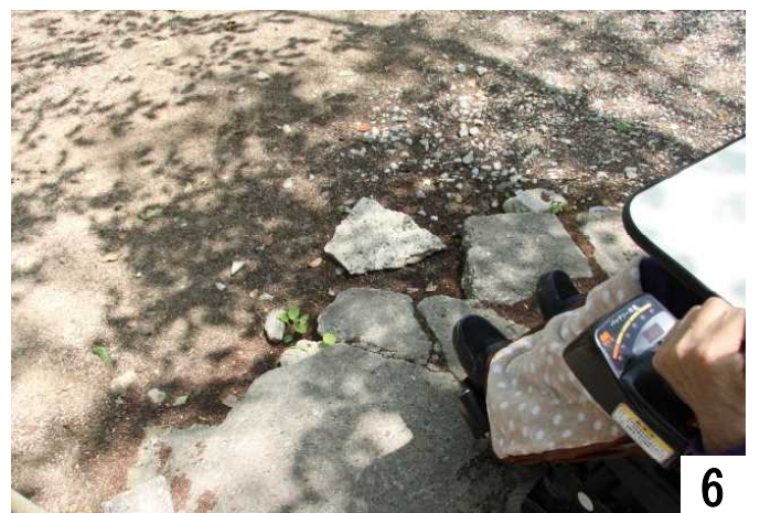
多目的トイレへ行けない通路(前方から)