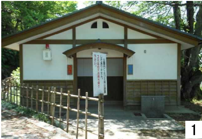
左：女性用 右：男性用

旧多目的トイレは、小丸山交差点から入園し、新多目的トイレは北側入り口から入園します。