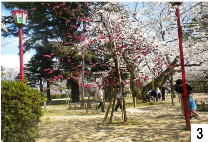
3 晴天の中、楽しむ花見客