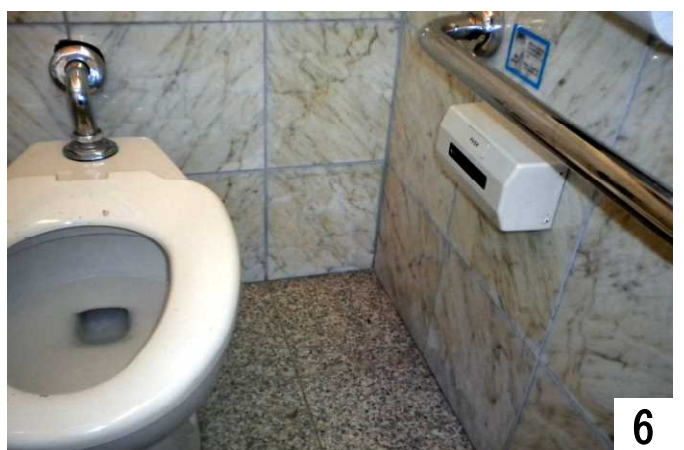
左右に手すり、右に手で触れる自動水栓装置