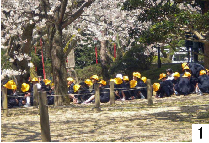
1 市内小学校の児童が花見遠足