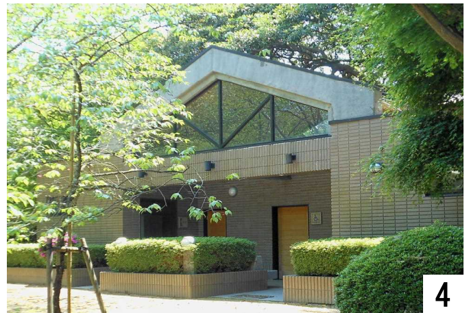
新多目的トイレの正面(北側入り口から入園)