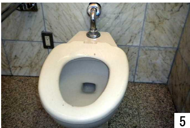
車いす利用者にとり低い便座(但し、個人差あり)

小丸山城址公園に新多目的トイレがありますが、便座が低いので車いす利用者は、使いにくいと思い