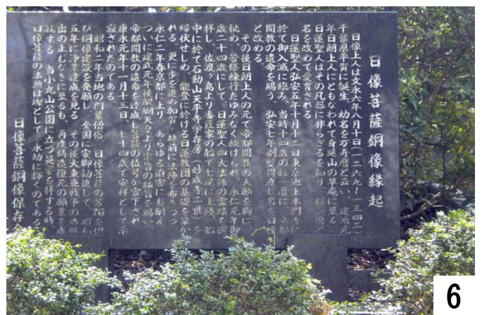
6 日像菩薩銅像縁起