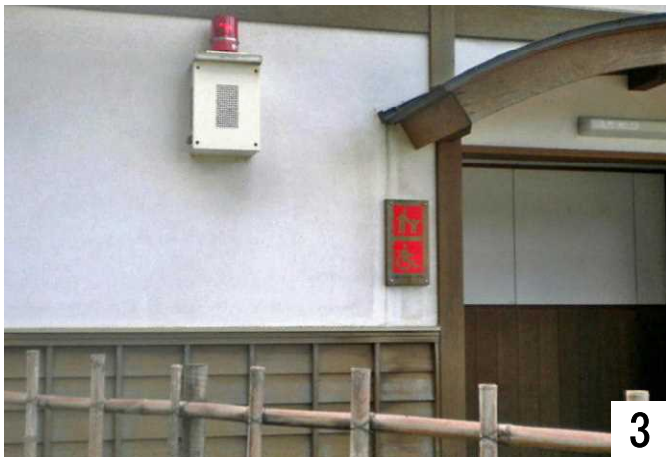
女性用車いすトイレ。赤ランプは緊急事態連絡用