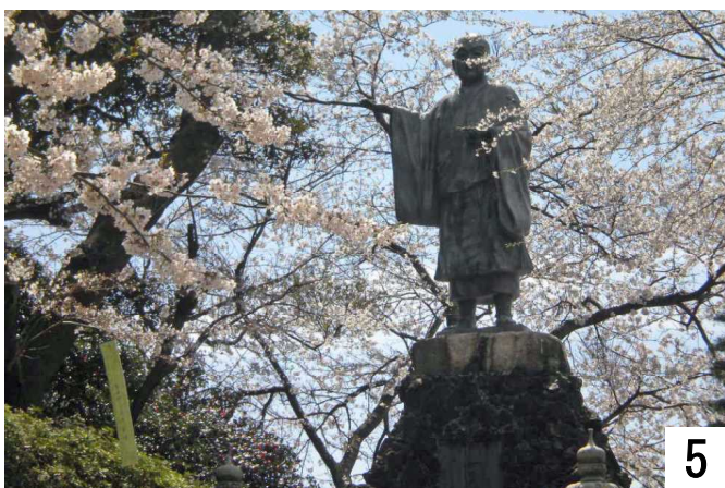
5 満開の桜に囲まれた「日像菩薩銅像」

日像菩薩は永仁元年24歳で、佐渡島より七尾に上陸。能登に於ける日蓮教団の基礎を築く。(⑥の銅像縁記より)