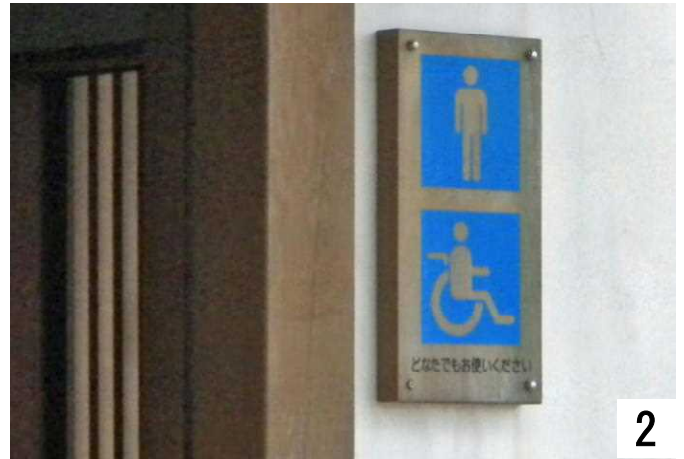
「どなたでもお使いください」と書かれているが？