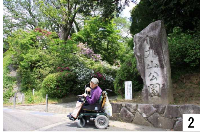
さあ、つつじの公園散策です。