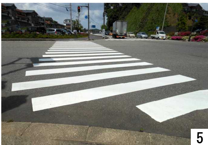
小丸山城址公園下交差点を和倉方面へ。