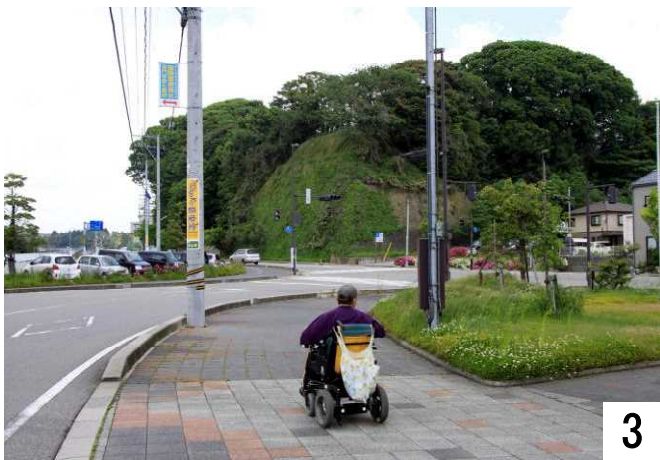
小丸山城址公園下交差点へ向かっています。

スタンド前の交差点、小丸山城址公園下交差点を横断し、小丸山城址公園へ向かいます。