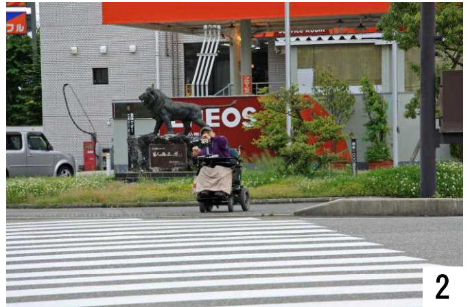
青信号だよ、早く渡って。