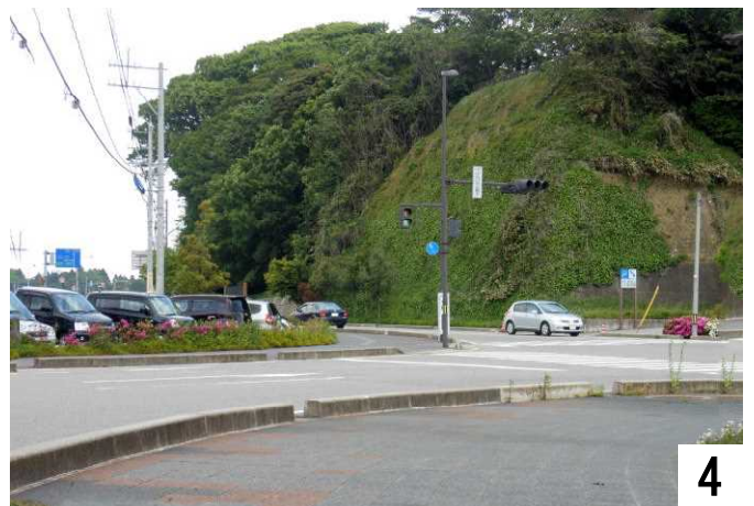
小丸山城址公園下交差点