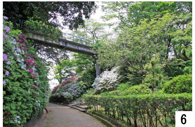
ピンク、紅色、白のつつじに吊り橋。