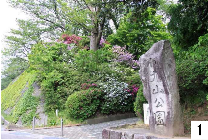
小丸山城址公園入り口、鮮やかなつつじ

今回の取材日は5月16日(金)でした。満開に咲くつつじの小丸山城址公園を味わい下さい。