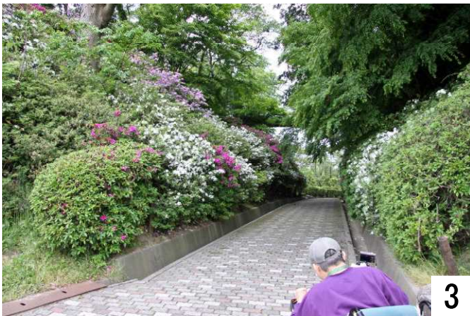
公園入り口はスロープになっています。