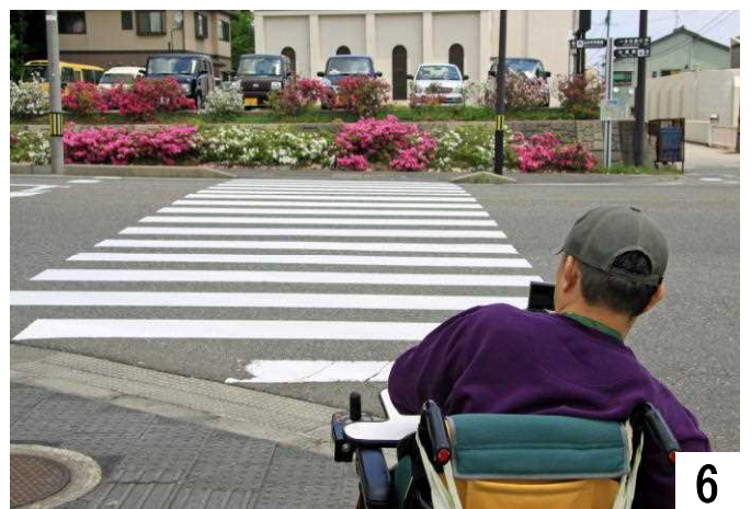
小丸山城址公園下交差点を小丸山城址公園方面へ。