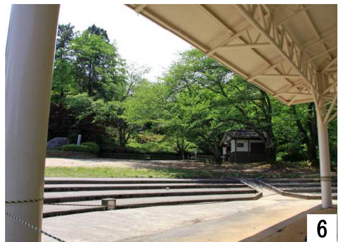
ここから、選手たちを応援しているのだろう。