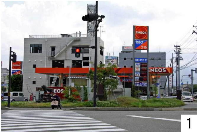
赤信号なので、デジカメをのぞいています。

電動車いすの空気圧を確認し、横断歩道を横断して小丸山城址公園下交差点へ向かっています。