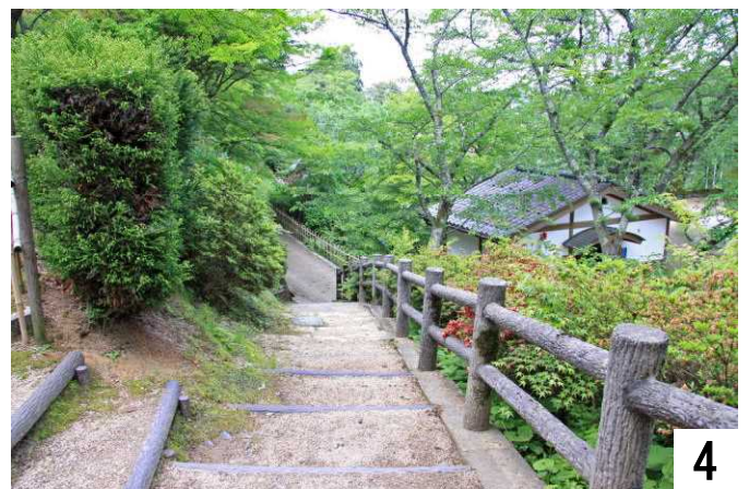
②の段を上り、上から撮影。