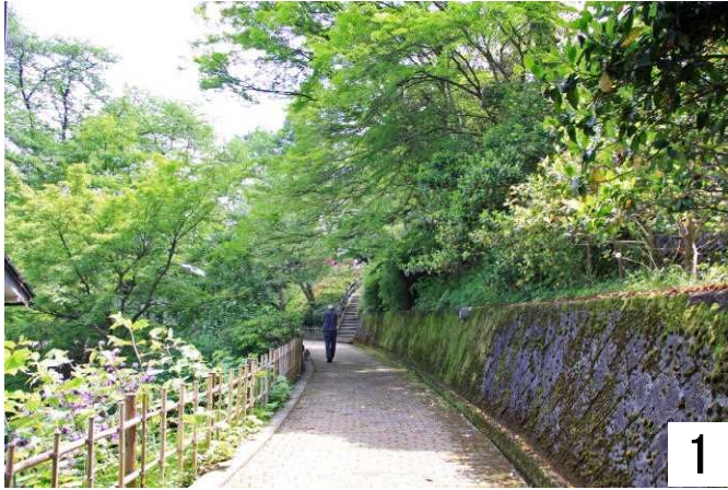
新緑のトンネルを散策します。

5月と言えば、新緑の季節です。樹木たちも眼に鮮やかな新緑が芽を出し始めています。