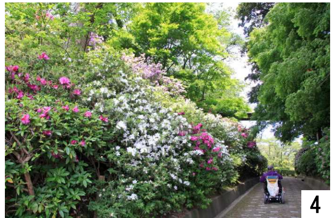
つつじの香りを楽しみ、公園へ入って行きます。