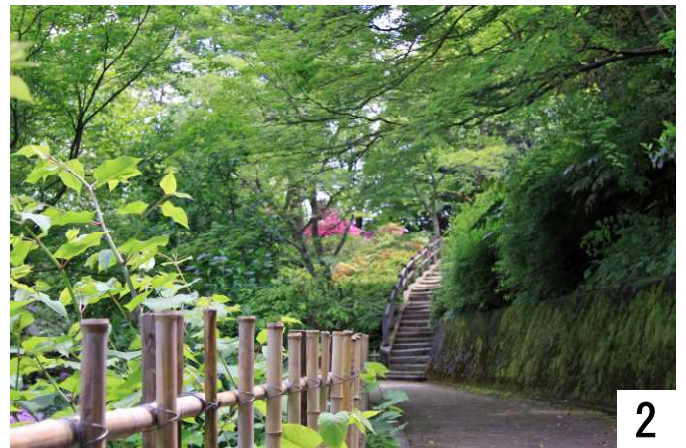
新緑に覆われ薄暗くなっています。