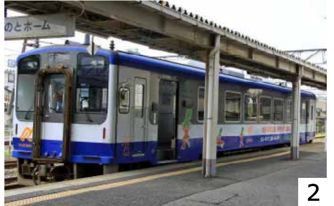
金沢から「和倉温泉わくたま号」が到着。