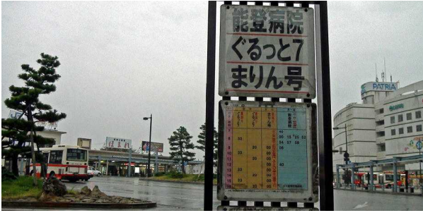
ぐるっと7駅前バス停