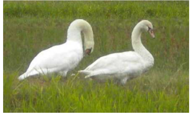
11月7日(月)午前撮影。2羽を確認。