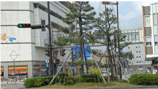
駅前の寄せ植え花壇