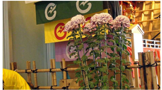
作者の以前の趣味は大菊作り