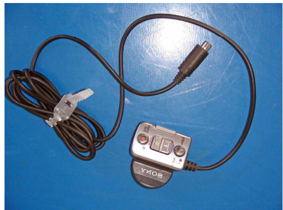
ビデオ、カメラのリモコン(オプションで市販中)