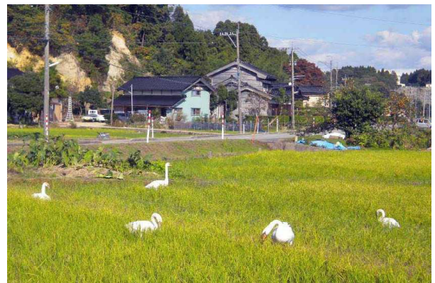
11月8日(火)午後撮影。親子5羽を確認。