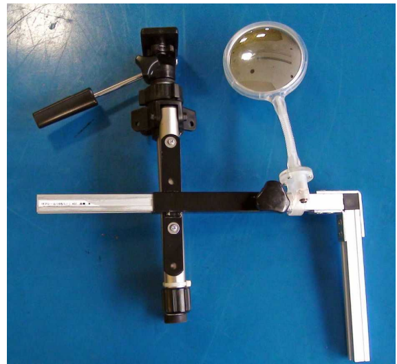
市販の三脚を自助具に改造