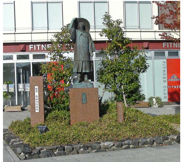
「ミナ・クル」前の長谷川等伯像