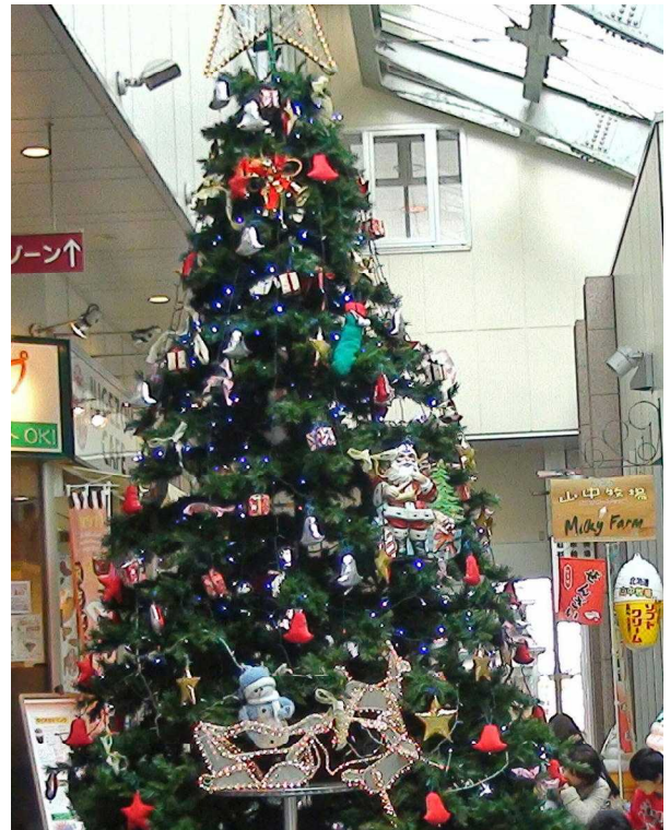
「ミナ・クル内」のクリスマスツリー