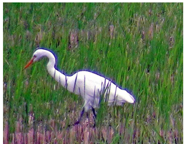
上はサギかな？カラスと仲良く遊んでいたが、撮るとき、カラスは飛び立って残念。