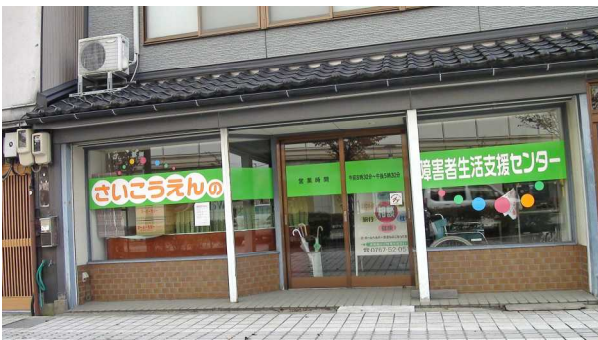
駅前支援センター正面