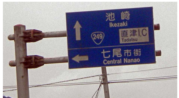
踏み切りから見た直津方面への案内板

踏み切りは左右をよく確認して渡りましょう。電動車いすは一気に素早く渡りましょう。