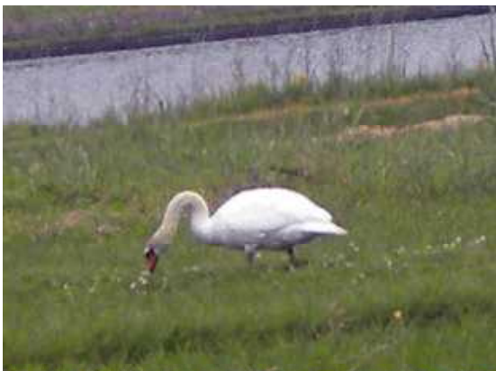
昨年6月は一羽ボッチ。寂しいな～