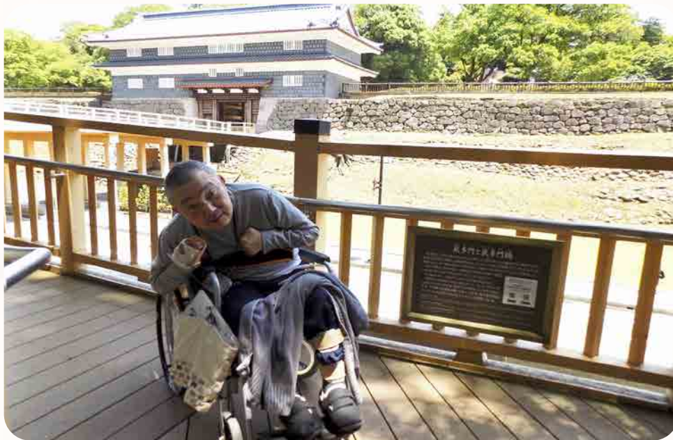
鼠多門橋の中央に橋の説明書き。金沢城を背に撮影

鼠多門橋を渡り金沢城へ向かう途中に、鼠多門橋の解説書きがありました。玉泉院丸と金谷出丸（現在の尾山神社境内）を結ぶ金沢城最大規模の木製であった。明治10年に撤去され、令和2年7月に同じ位置に整備された。